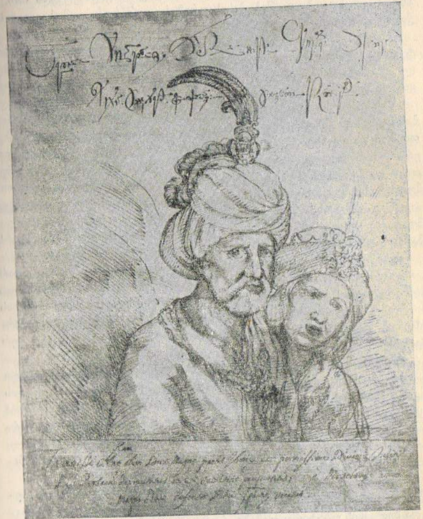
ლტოლვილი თეიმურაზ I და მისი მეუღლე. მისი თანამედროვე იტალიელი მხატვრის ნახატი (კასტელის ალბომიდან).

შაჰი ჩქარობდა. რუსეთმა თავი დააღწია გართულებულ საშინაო ვითარებას და სანამ იგი კავკასიის სარბიელზე ხელახლა გამოვიდოდა,