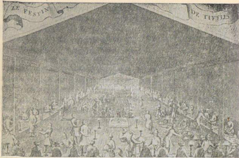
ქართლის მეფის საზეიმო დარბაზობა თბილისის სასახლეში 1672 წ. მისი თანამედროვე ფრანგი მხატვრის ნახატი (შარდენის წიგნიდან).

სუფლებლად 30.000 მოლაშქრე ეთხოვა მისთვის. თეიმურაზი დიდი პატივით მიიღეს, მაგრამ საგარეო პირობათა გართულების გამო რუსეთს იმჟამად შეიარაღებული ძალით დახმარების საშუალება არ აღმოაჩნდა. სამშობლოსაკენ მობრუნებულო, იმედგადაწყვეტილი თეიმურაზი — ყიზილბაშ დამპყრობთა წინააღმდეგ ნახევარი საუკუნის მანძილზე წარმოებული გამირული ბრძოლის მეტაფორა — ირანის შაჰმა ცრუ დაპირებით სპარსეთში მიიტყუა და დაამწყვდია ასტრბადის ციხეში, სადაც სამოცდაათობმეტი წლის მოხუცს 1663 წ. სული ამოხდა.