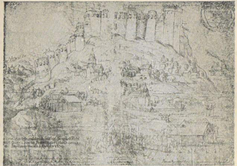
გორი და მისი ციხე. XVII ს-ის იტალიელი მხატვრის ნახატი (კასტელის ალბომიდან).

ქართლში სოფლის მეურნეობის ერთგვარ აღმავლობას ხელი შეუწყო XVII ს. 40—50-იან წლებში ზოგი ძველი სარწყავი არხის აღდგენამ და ზოგი ახლის გაყვანამ. ამ დროისათვის აღდგენილ იქნა XII საუკუნის არხი, რომელიც აერთებდა დიდსა და პატარა ლიანხეს; გაყვანილ იქნა ახალი არხებიც: ძვერისა, ტყეურეთისა, კარალეთისა, გარეჯურისა და თორტიზისა. დაიწყო ზოგიერთი გაუქაც-