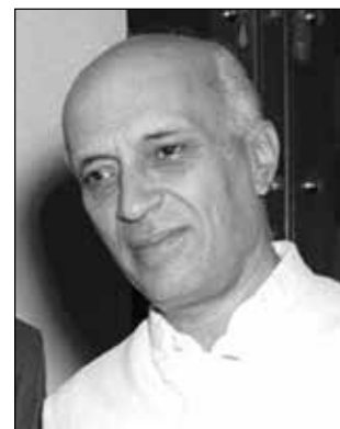
ჯავაჰარლალ ნერუ (1889-1964)