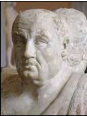
სენეკა (ძვ.წ.54-ახ.წ. 39)

სწორედ ამ უნივერსალიზმსა და რაციონალიზმზე რეაქციას წარმოადგენდა გერმანული რომანტიკული ნაციონალიზმი.