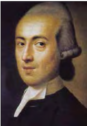
იოჰან გოტფრიდ ჰერდერი (1744-1803)

რაციონალიზმი კი ფილოსოფიური მიმდინარეობაა, რომელიც გონებას (ლათინურად – „რაციოს“) მიიჩნევს ადამიანის აზროვნებისა და მოქმედების საფუძვლად და მისი ყველა სასიცოცხლო მისწრაფების კრიტერიუმად.