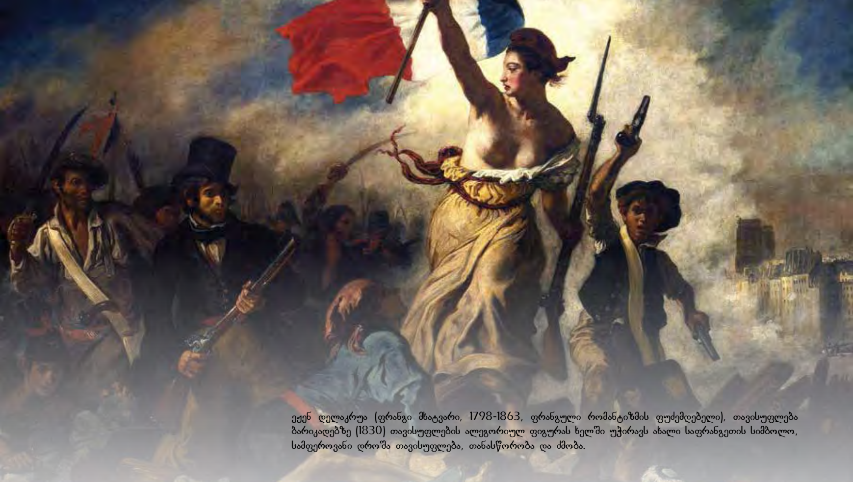
ევენ დელაკრუა (ფრანგი მხატვარი, 1798-1863, ფრანგული რომანტიზმის ფუძემდებელი), თავისუფლება ბარიკადებზე (1830) თავისუფლების ალეგორიულ ფიგურას ხელში უჭირავს ახალი საფრანგეთის სიმბოლო, სამფეროვანი დროშა თავისუფლება, თანასწორობა და ძმობა.

გამო ზოგიერთები ნაციონალიზმს ცარიელ ბოთლს ადარებენ: ფორმა არის, შინაარსი არ არის. შეიძლება ითქვას, უმრავლესობისთვის ნაციონალიზმს, როგორც ფორმას აქვს მნიშვნელობა, ხოლო უმცირესობისთვის მნიშვნელობა ექნებოდა იმ შინაარსს, რომელიც ამ ფორმაში ვერ მოექცა. მაგალითად, ინდოეთში დამოუკიდებლობის მიღებამდე ინდოეთის ნაციონალური კონგრესის პარტიამ ნაციონალიზმის იდეების წყალობით შეძლო ფორმალურად და არა შინაარსობრივად გაეერთიანებინა ისეთი განსხვავებული პიროვნებები, როგორებიც იყვნენ ჯავაჰარლალ ნერუ (რეფორმატორი, რომელსაც გონივრული დაგეგმარებისა სწამდა), კრიშნა მენონი (ორთოდოქსი მარქსისტი) და მაჰათმა განდი (ინდუისტი ასკეტი, რომელიც ინდუსტრიალიზაციის წინააღმდეგ გამოდიოდა). ზუსტად ასე, 1918 წლის 26 მაისსაც და 1991 წლის 9 აპრილსაც საქართველოს დამოუკიდებლობის აქტს ქართული ნაციონალიზმის სახელით ხელი მოაწერა პარლამენტში წარმოდგენილმა ყველა პოლიტიკურმა ძალამ – მათ შორის მემარჯვენეებმაც, მემარცხენეებმაც, კონსერვატორებმაც, ლიბერალებმაც და იმ ადამიანებმაც, რომელთაც საკუთარი პოლიტიკური პლატფორმა იმ მომენტისთვის არც ჰქონდათ გარკვეული.