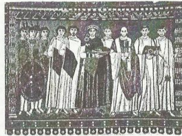
იუსტინიანე. მოზაიკა რავენის სან-ვიტალის ტაძრიდან

ლობდნენ ტრირში დასახლებული ღარიბი სულები (pauperes spiritu). როგორც პროფ. ნ. უსკოვი მიანიშნებს, ამ პერიოდში, 357 თუ 382 წლებში, “ნახევრადბარბაროსულ რაინის სანაპიროზე”, მიიღო პირველი ასკეტური გამოცდილება წმინდა იერონიმემ; IV საუკუნის 70-იან წლებში ტრირში ორჯერ ჩავიდა მარტინ ტურელი და, სავარაუდოა, აქ დააარსა თავისი მონასტერი თუ ეკლესია 19 . დასავლეთევროპული ცივილიზაციის სათავეებთან შეიძლება დავასახელოთ მეროვინგების ფრანკთა ისტორიის შემატთან გრიგორი ტურელი, ასევე ანგლოსაქსების პირველი ქრისტიანი შემატეანეები. მაგრამ ამ მწერლობის ხასიათი და ძირითადი დებულებები ისევე არ განსხვავდება რომის (ბიზანტიის) სიერცეში შექმნილი მისი თანამედროვე ნაშრომების ხასიათისაგან, როგორც არ შეგვიძლია ადრექრისტიანულ ხანაში რომის პაპების მოღვაწეობა ჩავთვალოთ იდეურად განსხვავებულად ბიზანტიის იმპერატორების მიზნებისა და ამოცანებისაგან.