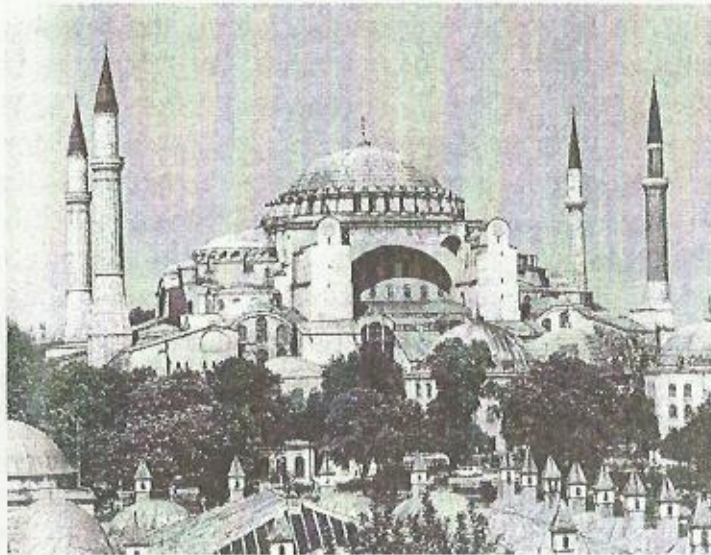
აია სოფიას ტაძარი კონსტანტინოპოლში

თაურის გრების გამოცხადებისა იუსტინიანე დიდთან და მისი გაქრისტიანების შესახებ 18