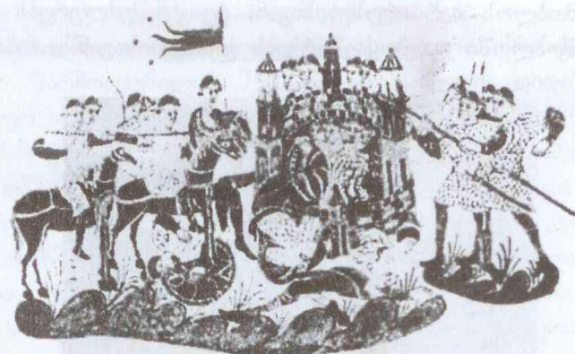
ფრანგი მეომრები. მინიატურა

რად შეიცვალა: ერში მყოფი ქრისტიანები იბრძოდნენ, ხოლო კლერიკალები და მონაზვნები ილოცებენ 46 .