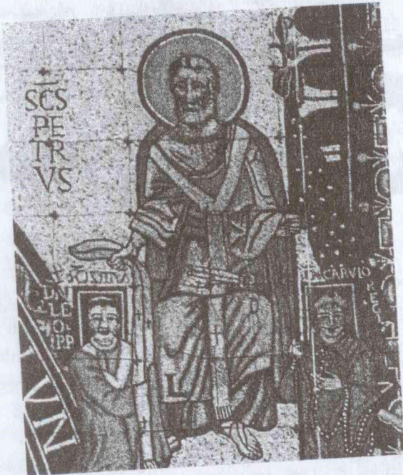
წმ. პეტრე აკურთხებს პაპს და კარლოს დიდს. მოზაიკა

საკითხი წმინდა მამათა — ნეტარი ავგუსტინეს, ამბროსი მედიოლანელის, ისიდორე სევილიელის შემოქმედებაში. ამბროსი მედიოლანელი იწონებს “მათ სიმამაცეს, რომლებიც იცავენ სამშობლოს ბარბაროსებისაგან, იცავენ უძღურებს თავიანთ სამშობლოში და მოკავშირეებს ყაჩაღებისაგან”.