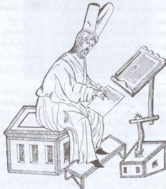
ბიზანტიელი სწავლული. მინიატურა

ადრეული შუა საუკუნეების იდეოლოგია ნათლად ჩანს საისტორიო ქრონიკებში. გვსურს წარმოვადგინოთ ზოგადი მახასიათებელი ევროპული საისტორიო მწერლობისა, რომელსაც განსხვავებული იდეოლოგიის ფონზე განსხვავებული ამოცანა და სრულიად განსხვავებული წერის მანერა აქვს.