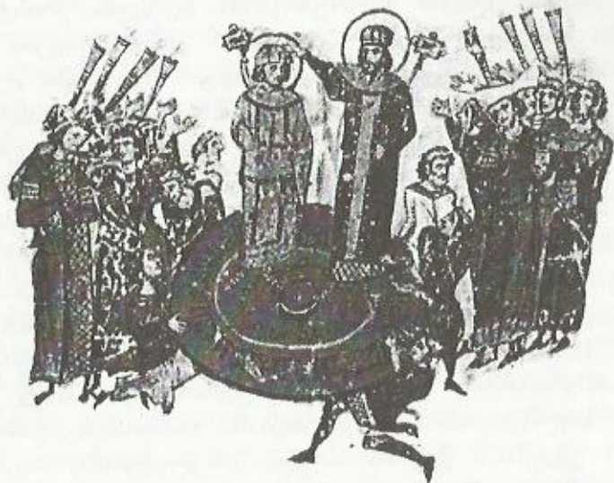
იმპერატორს ფარზე აყვანა. მინიატურა

აქამდე იმპერატორის არჩევისას შენარჩუნებული იყო რომაული წესები, როდესაც იმპერატორს ირჩევდა რომის ხალხი, ჯარი და სენატი. მოგვიანებით ამ პროცესში ჩაერთო ეკლესია. ბიზანტიაში იმპერატორის არჩევის დროს მიღებული იყო მისი ფარზე აყვანა, რაც, როგორც ჩანს, რომაელებმა გერმანელი ბარბაროსებისაგან აიღეს.