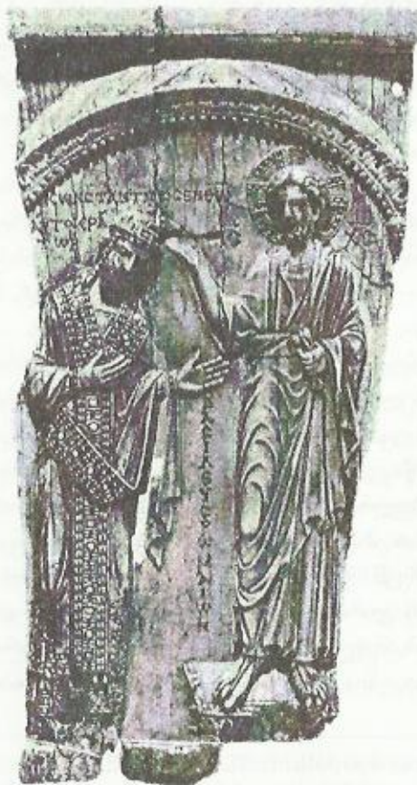
იმპერატორის კურთხევა. რელიეფი

“არ გექნებოდა არავითარი ხელმწიფება ჩემზე, მაღლიდან რომ არ მოგცემოდა. ამიტომ უფრო დიდი ცოდვა აქვს მას, ვინც ჩემი თავი გადმოგცა” (იოანე 19, 11). ასეთი შეხედულებანი არ ეწინააღმდეგებოდა ძველ აღთქმას, არამედ მის გაგრძელებას წარმოადგენდა: “მეფეო, შენ ის მეფეთა მეფე ხარ, რომელსაც ზეციურმა ღმერთმა ხელმწიფება და ძალა და ღიდება უბოძა” (დანიელ წინასწარმეტყველი 2, 37).