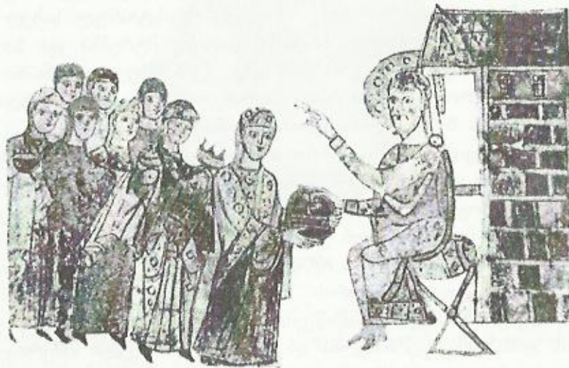
მატხოვარი აკურთხებს მრევლს. მინიატურა

ქმნული ძალითა ქრისტესითა ძლევამეძოსილი უვნებლად შემოიქცის 119 .