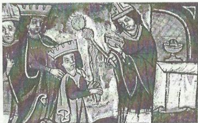
ქარლოს დიდის ნათლობა. მინიატურა

დავეთანხმებით ავტორის იქვე განვითარებულ მოსაზრებას: “კათალიკოსი მეფისათვის საჭირო იყო საეკლესიო მმართველი წრეების დასამორჩილებლად, რომელნიც მონარქის წინააღმდეგ იყვნენ განწყობილნი და ირანელთა კავშირში იმყოფებოდნენ” 101 .