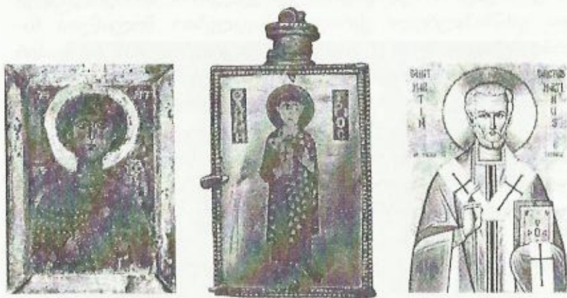
წმინდა გიორგი, წმინდა დიმიტრი თესალონიკელი, წმინდა მარტინ ტურელი

ომის უარყოფის თაობაზე, რომელიც, როგორც თავიდან აღ- ვნიშნეთ, მალევე იცვლება. ასევე მალე იცვლება ეს დამოკი- დებულება საქართველოში, ყალიბდება სახელწიფო სამხედრო მსოფლმხედველობა ქრისტიანულ იდეოლოგიაზე დაყრდნობით.