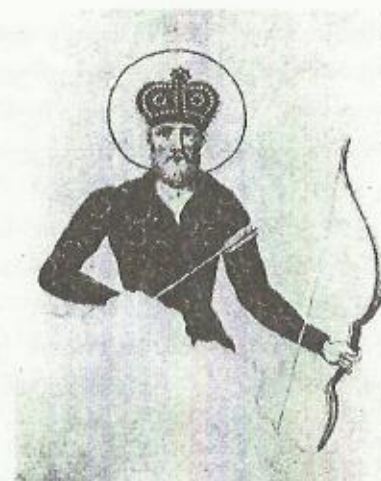
ვახტანგ გორგასალი. ფრესკა

ვახტანგ გორგასლის ცხოვრებიდან, ლეონტი მროველის თხზულების მსგავსად, შეიძლება სხადასხვა ციტატების მოყვანა ქრისტეს და ქრისტიანული სიმბოლოების შემწეობით მოტივირებისა, ნებისმიერი სახელმწიფო საქმის გადაწყვეტისა. ამ სიმბოლოთა შორის აქაც უმთავრესად ჯვარია წარმოდგენილი. ოსების წინააღმდეგ ბრძოლის დაწყების წინ მეფე აცხადებს: “არამედ მინდობითა ღმრთისაითა და წინამძღვარობითა ჯუარისა მისთა, — არა გამწიროს და მომცეს ძლევა” 114 .