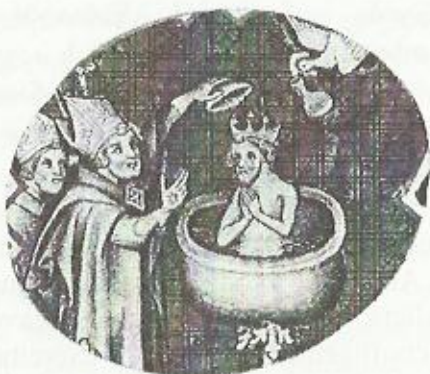
ხლოდვივის ნათლობა. მინიატურა

ამ ადვილს მაინც გვსურს დაუმატოთ ერთი ცნობა, ისევ გრიგორი ტურელის წიგნიდან ხლოდვივის ნათლობის შესახებ: რეიმის ეპისკოპოსი ეუბნება მას – “მორჩილად დახარე თავი (კეფა), სიგამბრო” (Mittis depone cola Sigamber). აქ ხლოდვივს უწოდებენ სიგამბრს, ეს არის სახელი ძველი გერმანელების ერთ-ერთი ტომისა, რომლებიც განსაკუთრებით იყვნენ გამორჩეულები, როგორც მეომრები. ამდენად, ეს უნდა ნიშნავდეს, რომ ხლოდვივმა შემდგომში უარი თქვას ომებზე, მაგრამ, ალბათ, უფრო წარმართულ სისხლისღვრაზე, რად-